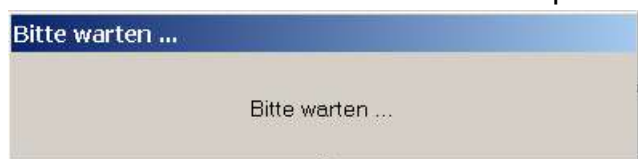
Abbildung 1 Informationsfenster beim Programmstart

Nach dem Start des Programms werden die Modules für die unterstützten Datenquellen eingelesen und gestartet. Jedes Modul beginnt dabei sofort mit dem Import der Kontakte aus der jeweils unterstützten Datenquelle. Während des gesamten Vorgangs informiert ein Statusfenster über den aktuellen Stand (Abbildung 1)